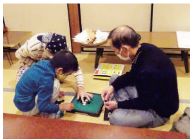
地域の方と一緒に楽しくオセロ