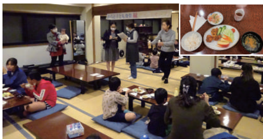
会場風景と今日の献立