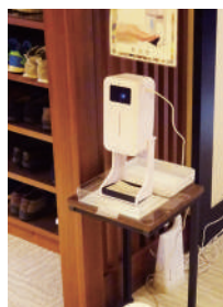
消毒と検温しますよ