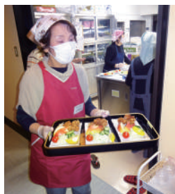
テキパキと動きます