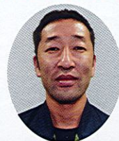
環境・防災対策部会 部会長

もちつき、焼き芋(ふれあい農園で収穫提供)、防災炊き出し体験、防災資料展示、避難所における段ボール間仕切り展示について。