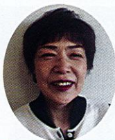
健康・福祉部会 部会長