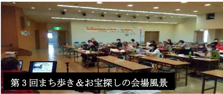
第3回まち歩き&お宝探しの会場風景

原則毎月部会を開催。10名程度の参加で計画の実施に向けメンバーは得意な分野で意見を交わしています