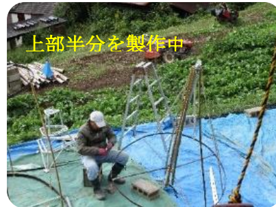
上部半分を製作中