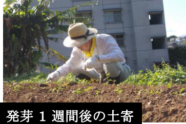
発芽1週間後の土寄せ