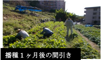
播種1ヶ月後の間引き